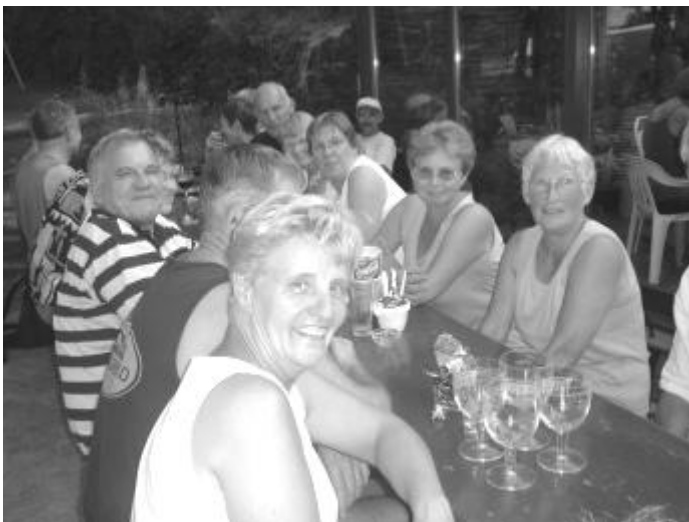
Tot een volgende keer.

ende tocht door een wonderschone Ourthevallei. Het parkoers was zwaar vanwege oneffenheden, soms steile klimmetjes en talrijke ferme afdalingen. De markering was niet optimaal en menigmaal moest op de gok een keus worden gemaakt. De temperatuur van 32° C was echter de grootste hindernis die we moesten nemen, en misschien ook wel die GSM-etjes die het maar niet willen doen.